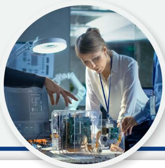
ผลงานระดับหลักสูตร*

ผลลัพธ์ที่ต้องการจากการวิจัย” หมายถึง สิ่งที่เกิดจากดำเนินการวิจัย ทั้งในเชิงองค์ความรู้ ผลผลิตทางวิชาการ นวัตกรรม หรือการประยุกต์ใช้ ที่สามารถตอบโจทย์ ปัญหาและความต้องการของสังคม/หน่วยงาน/ประเทศ และสามารถตรวจสอบหรือวัดผลได้