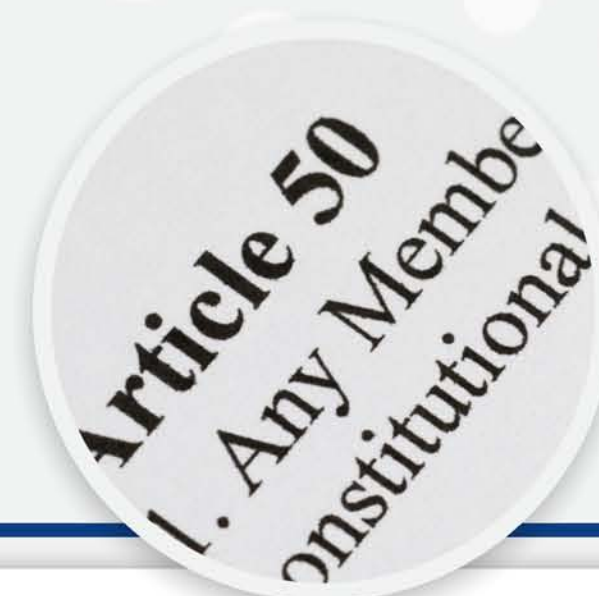
ผลงานตีพิมพ์ระดับนานาชาติ

ผลงานนวัตกรรมจากงานวิจัยที่ร่วมดำเนินงานระหว่างหลักสูตรกับหน่วยงานภายนอกที่มีบันทึกความเข้าใจ (MOU)