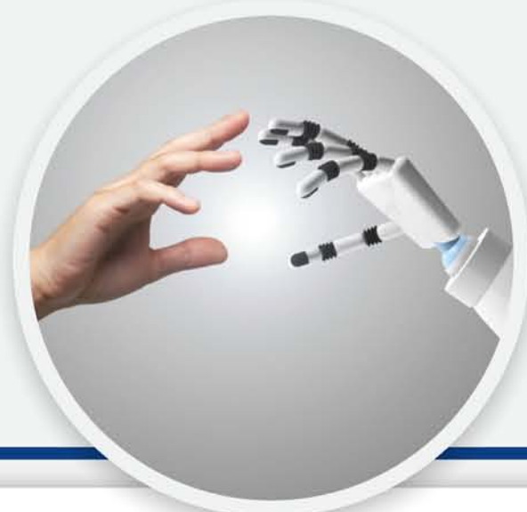
ผลงานนวัตกรรม

พัฒนาเป็นหลักสูตร Outcome-Based Education (OBE) ร่วมกันระหว่างหลักสูตรและหน่วยงาน